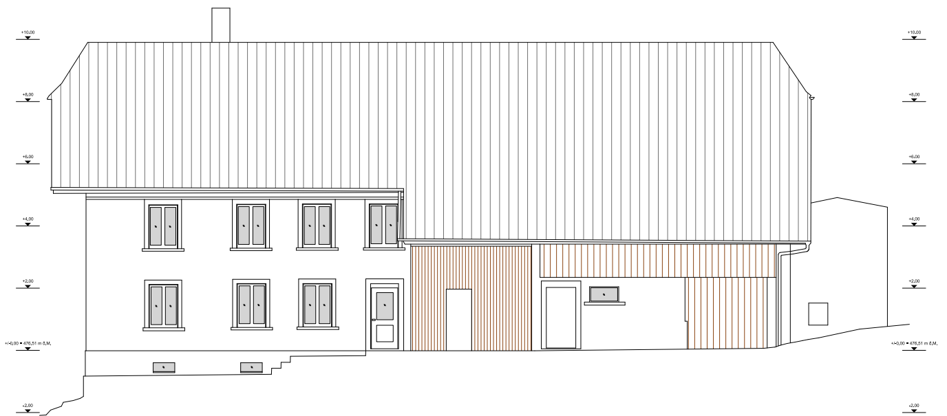
Fassadenansicht im Detaillierungsgrad 1:100